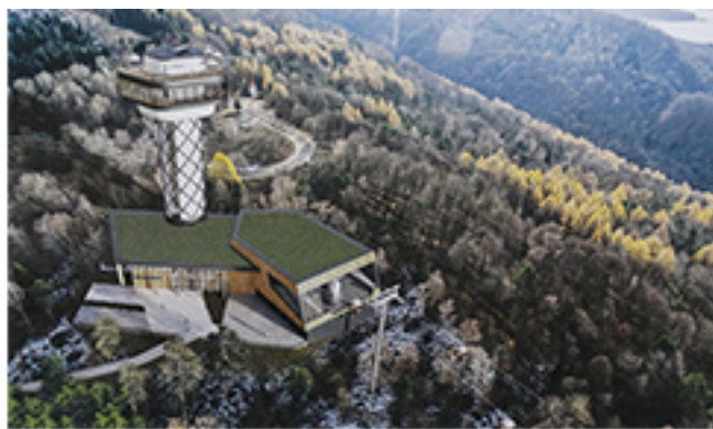
Górna stacja kolejki

Nie ulega wątpliwości, że budowa kolei gondolowej i wieży widokowej nad Jeziorem Solińskim będzie że jednym ze sztandarowych przedsięwzięć Polskich Kolei Linowych. Przygotowania do podjęcia tej decyzji trwały wiele lat. Najprawdopodobniej kolejka linowa nad Soliną została już wybudowana, gdyby nie przeszkody formalne. Na szczęście wiele z nich już usunięto i czas do rozpoczęcia inwestycji jest nieodległy.