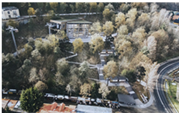
Dolna stacja kolejki

Poinformowano również, że w najbliższych latach 2019-2025, zostanie zainwestowanych ponad 400 mln zł na infrastrukturę turystyczną. Inwestycje mają unowocześnić i rozwinąć infrastrukturę w połączeniu z komplementarną obsługą hotelarsko-gastronomiczną, w szczególności w rejonie Zakopanego (Gubałówka, Kasprowy Wierch), Palenicy i Krynicy. 99,77 proc. akcji PKL należy do Polskich Kolei Linowych oraz Polskiego Funduszu Rozwoju.